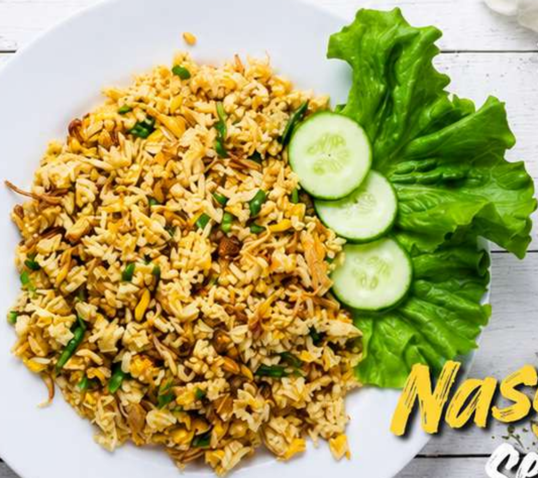
Nasi Goreng Bebek 25.000